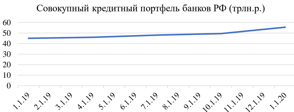
Рисунок 1 – совокупный кредитный портфель банков РФ за 2019-2020 годы

Основным изменением в стратегии развития российских коммерческих банков – агрессивная политика кредитования, увеличение объема выдаваемых кредитов. Так, за последний год совокупный кредитный портфель банков РФ увеличился более, чем на 23%, и достиг суммы, превышающей 55,5 трлн. рублей, что проиллюстрировано на рисунке 1 [1]. Увеличение кредитного банковского портфеля, прежде всего, направлено на увеличение прибыли компаний, однако тенденция портфельного роста может измениться в 2020 году в связи с кризисом малого и среднего бизнеса. Ввиду временного закрытия многих предприятий весной 2020 года количество отказов в выдаче кредитов физическим и юридическим лицам значительно увеличилось, что, несомненно, отразится на количестве просроченных кредитов и общей прибыли банков.