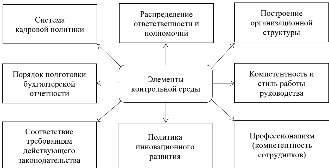
Рисунок 3 – Элементы контрольной среды [3]

Основным элементом данной системы выделяется контрольная среда, представляющая совокупность важнейших элементов внутреннего контроля организации.