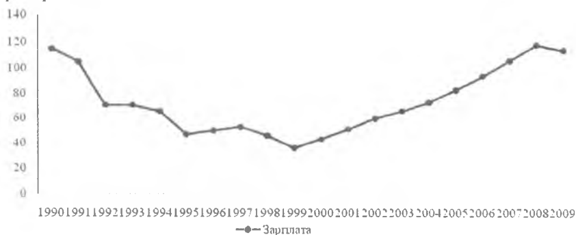
Рис 1. Динамика реальной заработной платы в России в 1990–2009гг., % [3]

В отличие от занятости, мало чувствительной к перепадам хозяйственной конъюнктуры, реальная заработная плата реагировала на внешние макроэкономические возмущения противоположным, сверхчувствительным образом. На рисунке 1 видно, что реагируя на каждый из трех самых сильных кризисных шока в течение первых восьми лет реформирования отечественной экономики (1992, 1994, 1998 гг.), заработная плата всякий раз опускалась на четверть или треть от предкризисной величины.