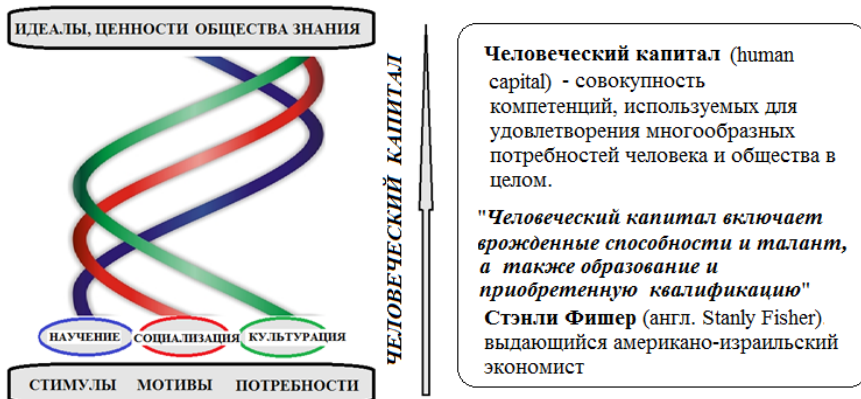
Рис. 1. Образовательная Тройная Спираль (ОТС), моделирующая динамику взаимодействий научения, социализации и культурации

Уместно напомнить, что, анализируя проблемы современности, выдающийся британский социолог Зигмунт Бауман (1925–2017) предпочитал говорить о liquid modernity («неустойчивой современности») вместо solid modernity («надежной современности»). Обеспечить конгруэнтность образования и социума в условиях liquid modernity , когда, словами З. Баумана, «мы продолжаем менять мир, ни на что особо не надеясь», – задача вовсе не тривиальная. И, осознавая, что в эпоху ante «знание, желанное для одних, может означать невежество и застой для других» (Франц Роузентал, 1914–2003) [8], мы предлагаем модель новой системы образования – модель Образовательной Тройной Спирали (ОТС), в полной мере обеспечивающую инновационно-опережающий характер и индивидуализацию образовательного процесса [10]. Эта модель строится, исходя из биосоциокультурной сущности человека (концепция профессора М.С. Кагана, 1921–2006), и предполагает, что в основе процесса образования лежит целенаправленное информационное воздействие на обучаемого. Модель визуализируется (рис. 1) как три переплетающиеся спирали (научение, социализация, культурация), которые разворачиваются во времени.