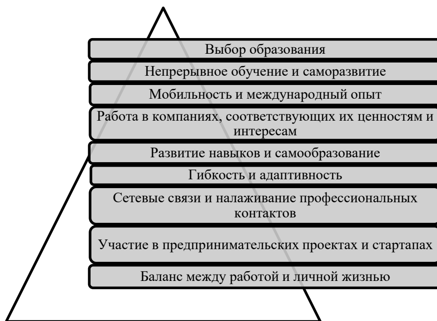
Рис. 2. Значимые факторы выбора стратегии занятости современной молодёжью Источник: авторское исследование

Анализ стратегии занятости молодежи в Тюменской области позволяет констатировать, что глобализация и цифровая трансформация расширяют границы, предоставляя не только возможности для трудореализации, но и изменения приоритетов в занятости. Можно выделить несколько ключевых факторов выбора стратегии занятости современной молодёжью (Рис. 2).