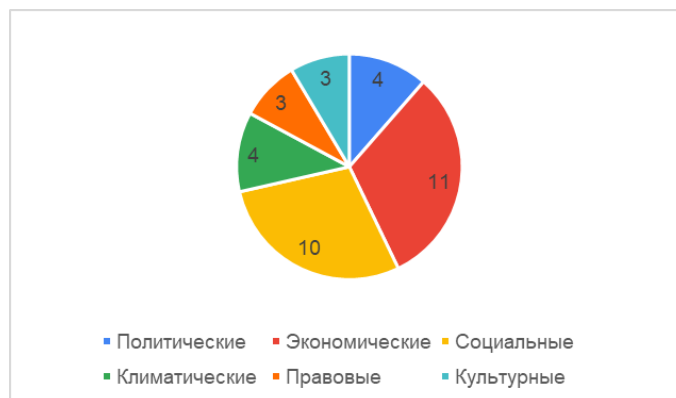
Рисунок 3 – Диаграмма, отражающая, какие причины эмиграции наиболее часто встречаются в ответах студентов

После анализа причин, обозначенных респондентами, были определены сферы, которые оказывают наибольшее мотивирующее влияние на желание эмигрировать. Так наиболее часто встречались экономические причины, во многом пересекающиеся с социальными: размер заработных плат, уровень жизни, медицины. И политические, например, нестабильное положение в стране. Встречались и правовые причины: в других странах «уважительнее относятся к правам человека», недовольство законом об оскорблении (рис. 3). Хотя эти названные особенности России есть и в других странах, например, в США тоже есть уголовная ответственность за оскорбление, тоже есть цензура.