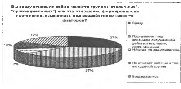
Рис. 4. Сразу ли Вы относили себя к какой-либо группе?

Для большинства приезжих в столичный город процесс адаптации к новому месту жительства являлся довольно долгим и сложным процессом. Именно поэтому 37% респондентов ответили, что относить себя к столичным жителям они начали не сразу, это отношение формировалось под влиянием окружающей среды. Но для 27% данного этапа не существовало, они сразу отнесли себя к ним. 12% опрошенных признались, что они не относят себя ни к провинциалам, ни к столичным жителям до сих пор. 17% респондентов затруднились ответить на данный вопрос (Рис.4).