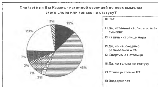
Рис. 2. Казань – истинная столица?

Следующий вопрос позволил выявить соответствует ли Казань представлениям жителей понятию столичности. Результаты показали, что 45% респондентов считают Казань истинной столицей во всех смыслах этого слова, 23% уточняют, что она является столицей лишь субъекта РФ, 12% опрошенных не признают Казань в качестве столицы вообще (Рис. 2).