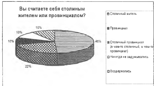
Рис. 3. Считаете себя столичным жителем или провинциалом?

Для большинства приезжих в столичный город процесс адаптации к новому месту жительства являлся довольно долгим и сложным процессом. Именно поэтому 37% респондентов ответили, что относить себя к столичным жителям они начали не сразу, это отношение формировалось под влиянием окружающей среды. Но для 27% данного этапа не существовало, они сразу отнесли себя к ним. 12% опрошенных признались, что они не относят себя ни к провинциалам, ни к столичным жителям до сих пор. 17% респондентов затруднились ответить на данный вопрос (Рис.4).