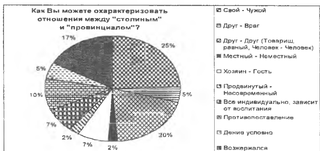
Рис. 5. Взаимоотношения между «столичным жителем» и «провинциалом»

как «свой – чужой». Радует тот факт, что 20% все же характеризуют данное отношение как дружеское или товарищеское, на третьем месте оказался ответ, что в Казани наблюдаются отношения противопоставления (10%) (Рис. 5).