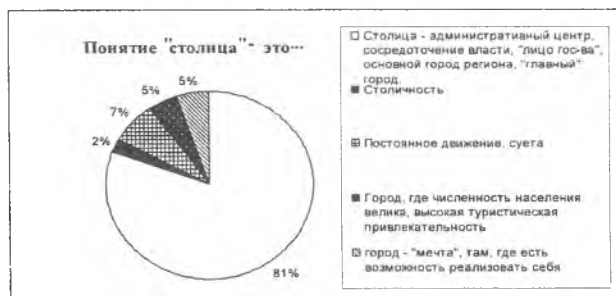
Рис. 1. Определение понятия «столицы»

Что же такое столица и что под этим понятием подразумевают люди, живущие на территории столичного города? По данным проведенного опроса для 81% опрошенных считают, что столица – это административный центр, место сосредоточения власти, "лицо государства", основной город региона, "главный" город. Оставшийся процент голосов распределился следующим образом: столица – это постоянное движение, суета; это город, где численность населения велика, высокая туристическая привлекательность; это город – "мечта", там, где есть возможность реализовать себя (Рис. 1).