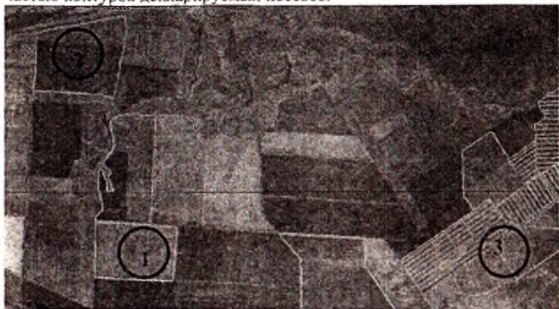
Рис. 3. Определение границ посевов озимых культур по ДЛЗ:

Министерством сельского хозяйства Самарской области принято решение в 2009 году внедрить систему для всех 27 районов Самарской области с дополнением отчетных форм сельхозпроизводителей графической частью контуров декларируемых посевов.