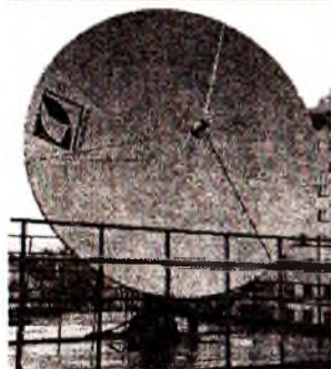
Рис. 1. Центр приема космических снимков на основе станций приема Унискан-24 разработки ИТЦ «Сканэкс». Серым фоном в таблице выделены спутники, передающие данные в режиме «постоянного приема»

Другими направлениями деятельности ПЦКГИ являются: