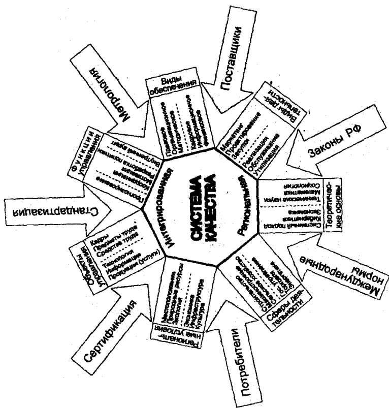
Рис.3. Взаимосвязь системы качества регионального уровня с формирующими ее воздействиями